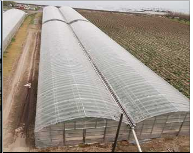
取材をさせて頂くハウスです。 長さは100m近くあるそうです。