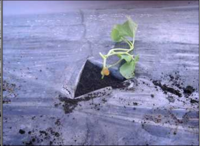
ハウス圃場 十分に育った苗が、圃場へ定植されました。