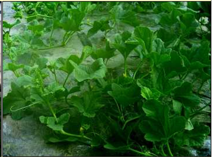
定植から35日目です。 ここまで大きくなっています。