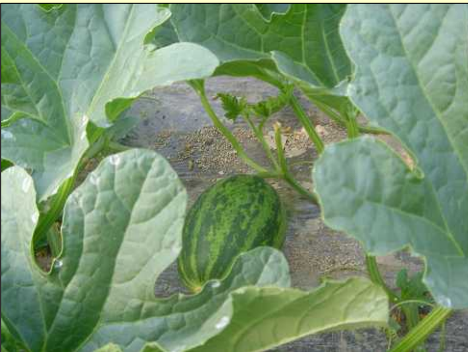
定植から65日目です。 既に果実が実っています。