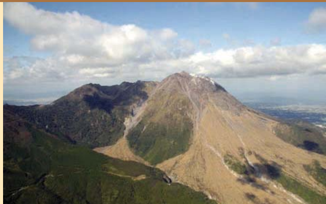
雲仙岳 南東側上空から撮影 九州地方整備局の協力による