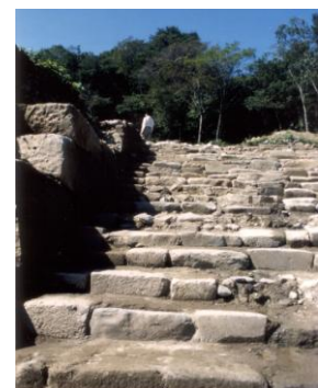
天正遣欧少年使節も登った日野江城の階段遺構