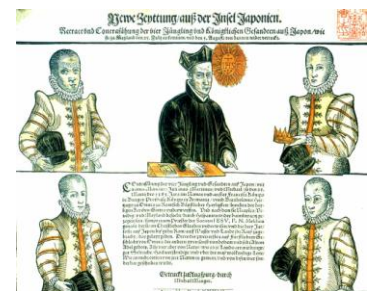
天正遣欧少年使節像