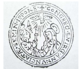
有馬のセミナリヨで組織された日本初の生徒会 お告げの聖母の組の判印