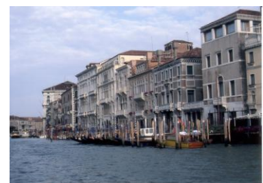
4 少年が訪れたイタリア