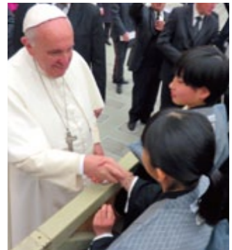
『430年の時を経てローマ教皇に謁見』 平成遣欧少年使節イタリア派遣事業(4～5)