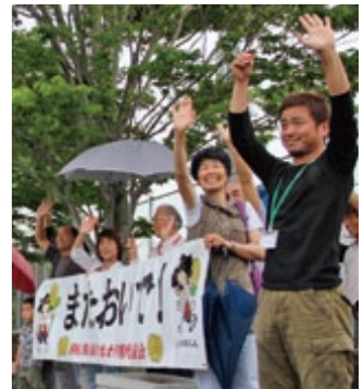
『農林漁業体験民泊』 特集(8～9)