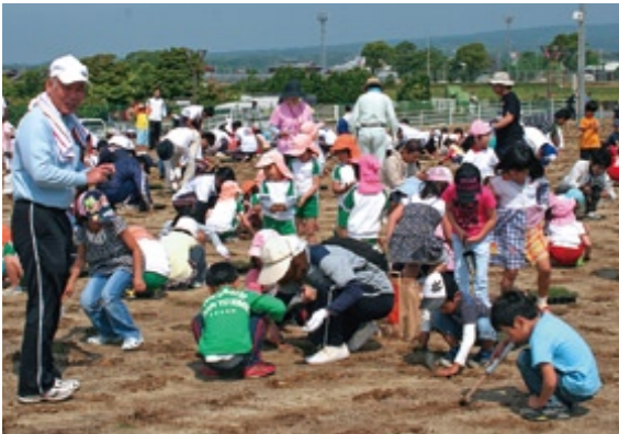
みんなで力を合わせた芝生植え *詳細20ページ：まちの話

こうして考えてみると、総合型クラブの理念が、まちづくりの考え方に非常に似ていることがわかります。