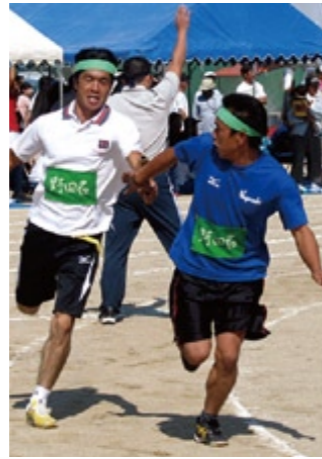
にぎわいを見せる地区体育祭

人口の減少などで、地域に元気がなくなった、という話をよく聞きます。少なくなった子どもたち。多くなった高齢者。市や地域でも、地域再生、活性化のために頑張っていますが、まだ十分とは言えない状況です。