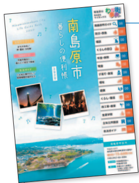
「暮らしの便利帳」イメージ