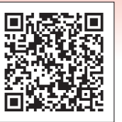
QRコード 長崎県新しい生活様式 対応支援補助金

☒店舗などにおいて消費者などと接する機会が多い、県内の中小企業・小規模事業者 ※対象業種はQRコード(県ホームページ)にてご確認ください。