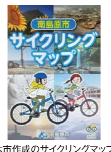
本市作成のサイクリングマップ