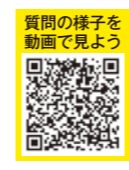
質問の様子を動画で見よう