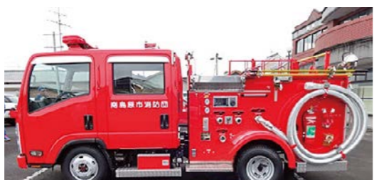
【同等品の写真】深江第4分団へ配備

(答弁) 排ガス規制の強化や装備品の資機材の高騰により、従来の金額よりも高騰している。