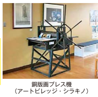
銅版画プレス機 (アートビレッジ・シラクノ)

数はどれくらいか。また、今後の見直しはどのようなか。 教育次長 令和3年度が1,391人、令和4年度が1,865人で計画よりは多くなっている。今後は銅版画発祥の地ということで、県の移動美術館などと連携して、事業の周知と安定した運営をやっていきたく考えている。