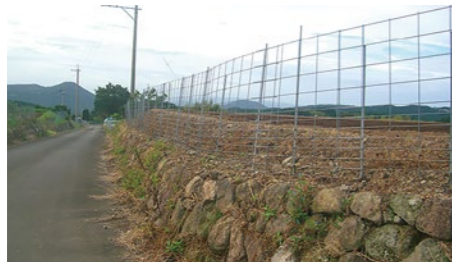
設置されたワイヤーメッシュ柵

議員 空き家を活用した移住対策はある程度効果を上げていて、人口減少対策として市内に残る人に定住支援金を創設してはどうか。