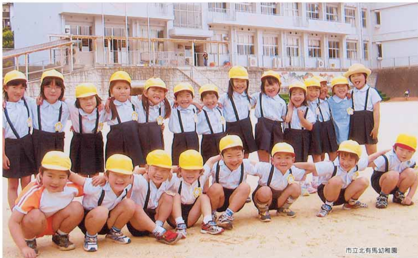
市立北有馬幼稚園