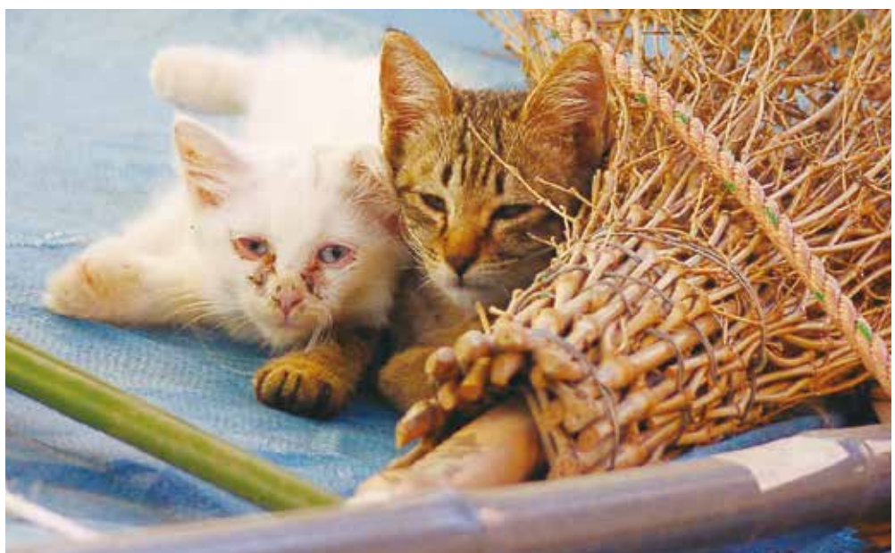
捨てネコ・捨てイヌは犯罪です。

2020年から、ミドリガメも特定外来生物に指定され、飼育する時は届出が必要になり、罰則・罰金が制度化されるが、対策は。