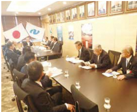
要望・提案活動の様子(長崎県議会議長室)