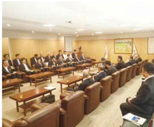
要望・提案活動の様子(長崎県庁特別応接室)