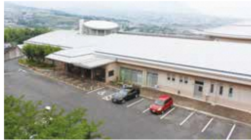
布津福祉センター「湯楽里」

質疑 「必要な事業を行 うものとする」とあるが、 どんなものを考えている のか。