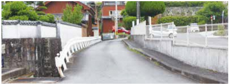
新たに市道認定された市道新町線

返却した残りのスペースで、道路以外の部分については、まず宅地分譲ということで進めさせて頂きたいと考えているが、地域振興部と一緒に計画を進めているので十分協議をしていく。