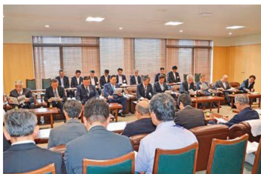
要望・提案活動の様子（長崎県庁特別応接室）