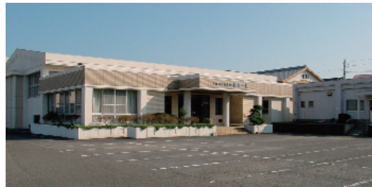
布津多目的集会施設

4番地が1354番地1と1354番地2に分筆され、現在の施設の位置が1354番地1となったためである。