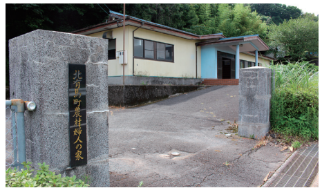
北有馬農村婦人の家

北有馬農村婦人の家の位置について、「南島原市北有馬町丙6209番地19」を「南島原市北有馬町丙6209番地10」に改正するもの。錯誤の理由としては、平成21年8月13日の国土調査により6209番地10に合筆されたものである。