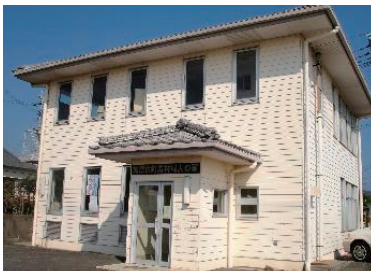
加津佐農村婦人の家

当時から地番の表記に誤りがあったため、1204番地の1を正しい表記である1204番地1に改正するものである。