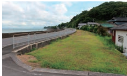
島原鉄道線路跡地 (南有馬町)