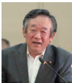
黒岩 英雄 議員