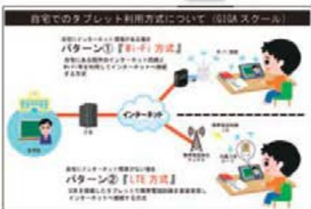
GIGA スクール (Wi-Fi と LTE の違い)

教育次長 学級閉鎖などの場合、家庭で、オンライン、通信回線を通じた授業も受けられるよう学習端末を配備している。今回、夏休み、初めて自宅に持って帰ってもらい通信環境を確認した。教職員の習熟を図る研修を実施し、早い段階でオンライン授業ができるようにしたいと思っている。