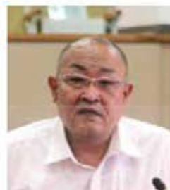
隈部 和久 議員