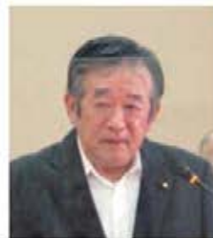
黒岩 英雄 議員