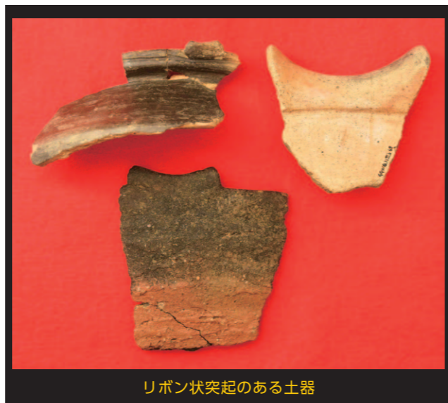
リボン状突起のある土器

驚くべきはリボン状突起つきの土器が出土する遺跡の分布範囲で、それが九州一円だということです。なんの通信手段もなく人から人へと自らの足でつなぐしかない時代に、共通の美意識を広く共有していたことがわかります。「これがついてなきゃ土器とはいえないね」、そんな九州縄文人のこだわりの声が聞こえてきそうです。