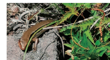
道の横で日差しを浴びているトカゲ