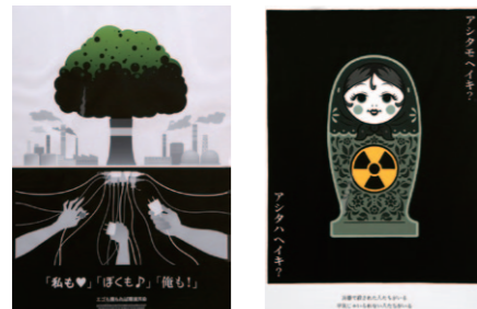
【デザイン部門】NIB長崎国際テレビ賞 馬場貴大 【デザイン部門】KTNテレビ長崎賞 馬場美保子