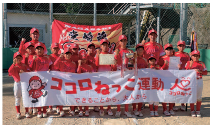
優勝した堂崎小ソフトボールクラブの皆さん