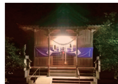
真夜中の温泉神社で、かすかに水のせせらぎと海の遠い音が聞こえる気がします