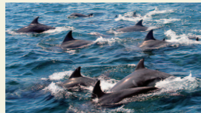
イルカウォッチング