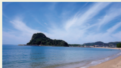
前浜海水浴場(加津佐町)