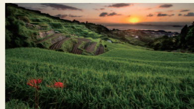
谷水棚田(南有馬町)