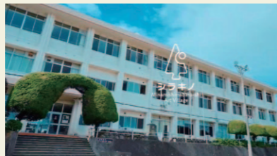
アートビレッジ・シラキノ(南有馬町)