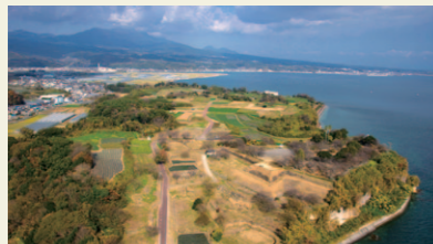
【世界文化遺産】原城跡(南有馬町)