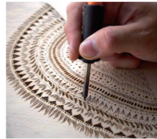
木を焦がして版画を作ろう