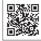
アートビレッジ・シラキノ HP

新型コロナウイルスの感染状況によっては中止または延期する場合があります。マスク着用・手指消毒などのご協力をお願いします。