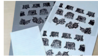
リトグラフでレターセットを作ろう