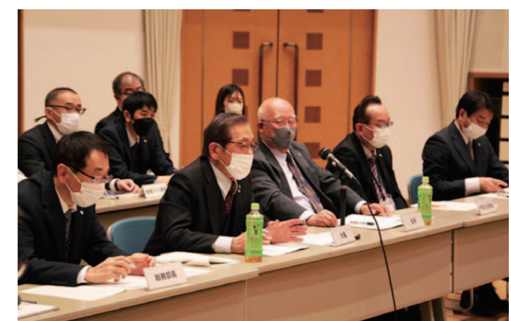
回答を行う松本市長