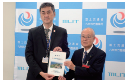
(国土交通省九州地方整備局長：左)