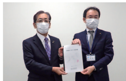
(長崎県土木部長：右)