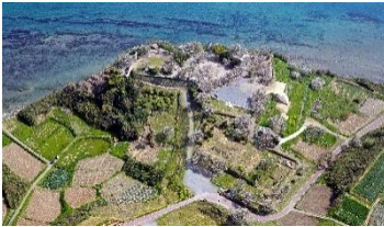
〈世界文化遺産 原城跡〉