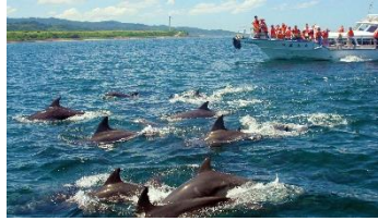
〈イルカウォッチング〉

絵師が、あまりの美しさに絵を描くことができず筆を落としたと言われるほど美しい滝。