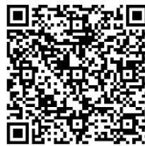
市LINE公式アカウント (情報登録)

市LINE公式アカウントでは妊娠期から小学校就学前をメインに子どもの成長段階に合わせて自動で情報を配信する機能を8月1日に導入します。「出産予定日」や「生年月日など子どもの情報」を登録するだけで自動的に健診や相談などの情報が届いてとても便利です。