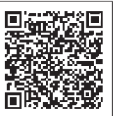
認定商品活用推奨事業補助金ページ

補助金の申請書類および「おいしい南島原ブランド認定商品」は市ホームページでご確認ください。