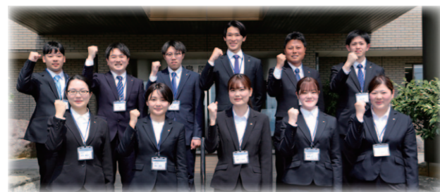
令和5年度新規採用職員

平成10年4月2日以降に生まれた人で、保育士の資格および幼稚園の教員免許状を有する人または令和6年3月までに当該資格を取得する見込みの人