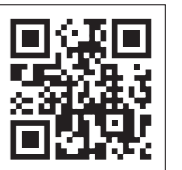
エルタックス サイト

※MINAコインなどのスマートフォン決済アプリやコンビニ納付も引き続き利用できます。