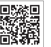
南島原市地域包括支援センターHP