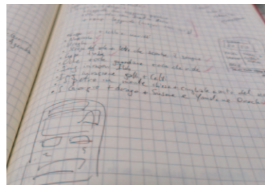
他の珍しい音② 今回も「スクリブスクリブ」とまめに書いたコラムの原稿のノート