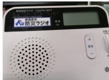
他の珍しい音① 防災ラジオの電波調整の音が「トゥーグリラリ」に聞こえます

このように、皆さんにありふれた一日でも、外国人の耳には違うように鳴り響きます。皆さんも、変な音が聞こえる時に、外国でどんな音がするのかと想像してみてください。そして、市内に「フルシュフルシュ」と髪の毛が風に揺られる音が聞こえたら、「エマ!」と話しかけてください。