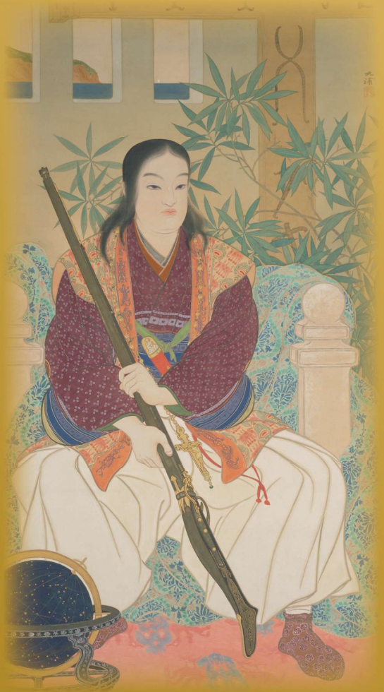
右上：「天草四郎肖像」 明治7(1874)年/月岡芳年 木版色摺/西南学院大学博物館蔵(同館画像提供)