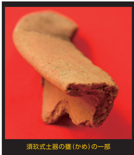
須玖式土器の甕(かめ)の一部

須玖式土器の時代、北部九州では各地に「クニ」とよばれる地域社会が成立し、そこを治める有力者たちは、積極的に大陸や南の島々とも交流をもちました。有明海は北部九州と外洋とを結ぶ海の玄関口だったのです。南島原の弥生人も積極的に北部九州の人々と交流をもち、もしかしたら外洋への橋渡しの役割も担っていたかもしれません。