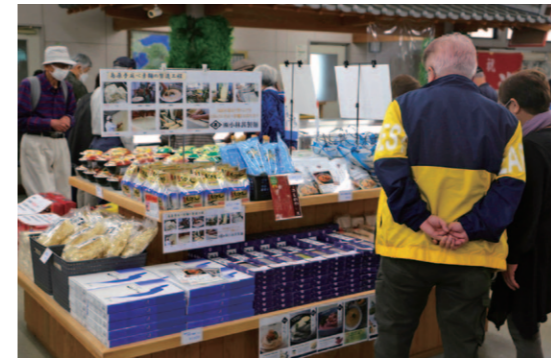
地元の商品が勢ぞろい