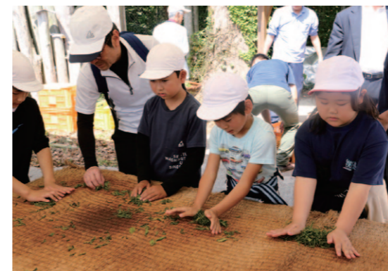
茶揉みをする児童