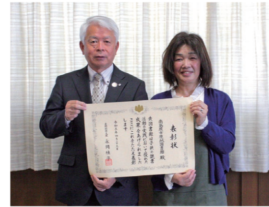
左から松本教育長、植木図書館長