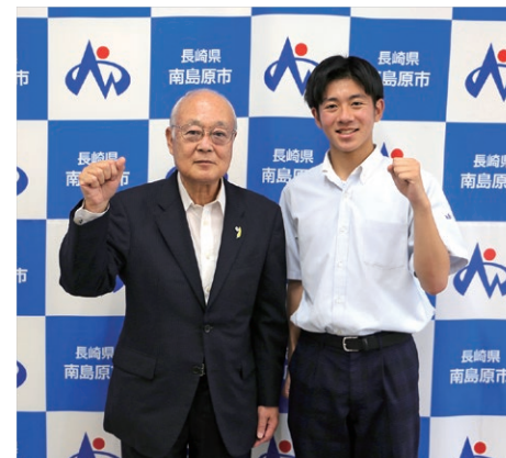
左から山口副市長、溝田選手