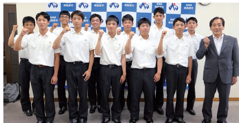
島原工業高校ソフトボール部選手と松本市長