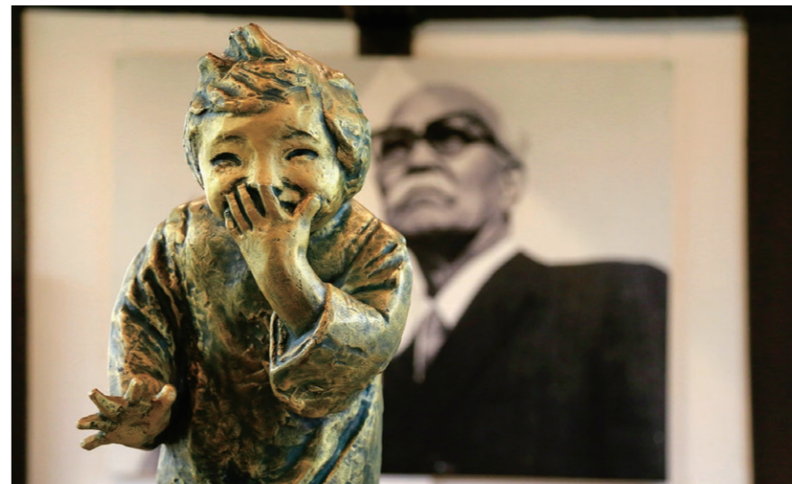
喜ぶ少女の後ろに 撮影日: 2017年11月 場所: 西望公園(記念館) 南有馬町

シティプロモーション推進事業に関するお問い合わせ 閩総務秘書課(西有家庁舎) ☎73-6621 Eメール: hisyokouhou@city.minamishimabara.lg.jp