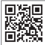
水に流せるまち 特設ページ