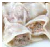
元祖 長崎台湾肉汁水餃