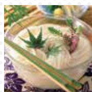
島原手延そうめん