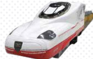
協力:JR九州長崎支社