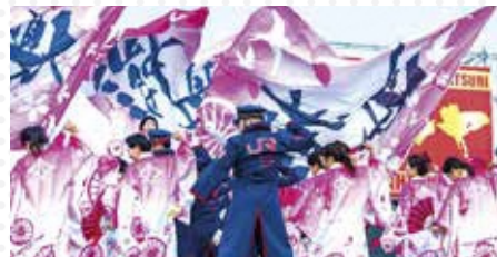
JR九州「櫻燕隊(おうえんたい)」