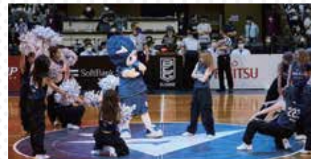
「LUCA・長崎ヴェルカチア&ダンサーズ」ステージ