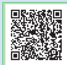
事前申請 Web ページ

転入・転出・転居、出生・死亡、住民票の写し・印鑑証明書・戸籍等の交付申請など ※一部対象外の手続きがあります。