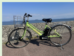
シティサイクルタイプ