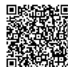
サイクリングマップ QRコード