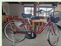
シティサイクル (ママチャリ)