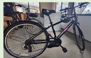
スポーツサイクル