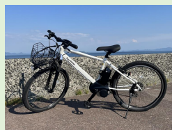
スポーツサイクル