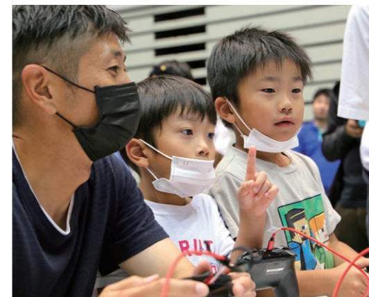
eスポーツを楽しむ親子

今後も高齢者学級や子ども会活動などさまざまな分野でeスポーツの活用を推進していきます。