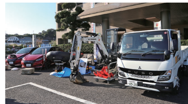
配布資機材の一部