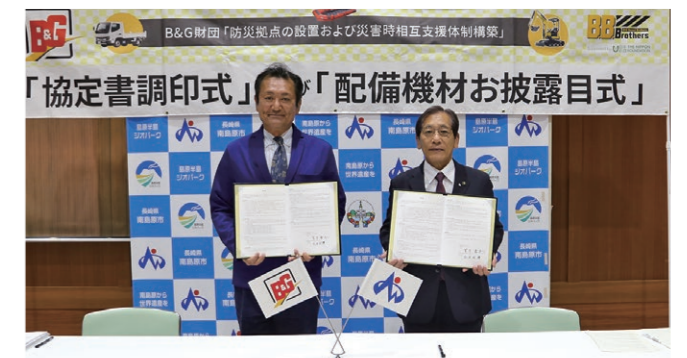
左から菅原B&G財団理事長、松本市長