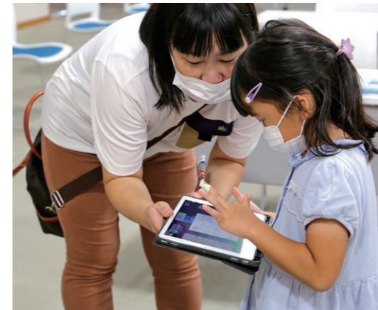
ドローンプログラミング体験