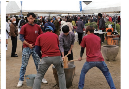
4Hクラブの餅つき実演と販売