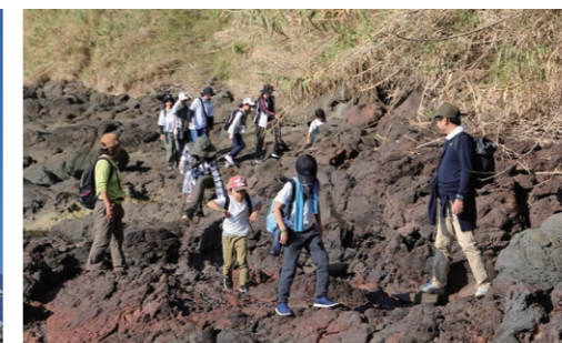
玄武岩の早崎海岸