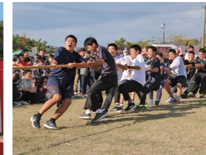
綱引き 大人の部 優勝「受験生(加津佐中3年生)」