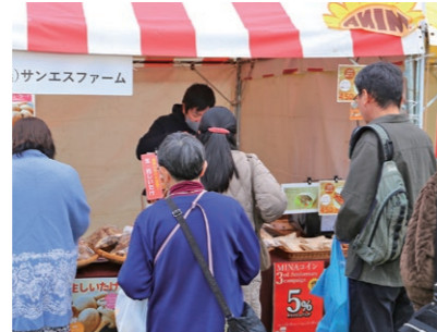
特産品販売ブース