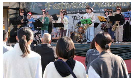
鎮西学院大学ジャズアンサンブル部