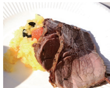
長崎和牛とサフランライス

そのほかにも、長崎和牛のローストビーフ・サフランライスの試食会、イタリア・ポルトガルとのライブ中継、吉田栄作さんのミニコンサートなど多くの催しが行われ、来場者は少し早いクリスマスを楽しみました。