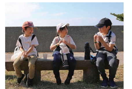
パンとお茶のおもてなし

3月3日開催決定!! 「九州オルレ ウォーキングフェスティバル2024 in 南島原コース」(詳しくはP6をご覧ください)