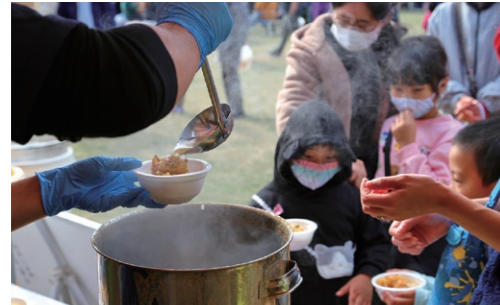
ソラシドエア機内提供スープ×島原手延そうめんの無料ふるまい

また、おいしい食のブース以外にも「Remember 3.11」による自衛隊車両の展示やはしご車体験などの防災関連ブースなどが出展し、訪れた約1万人はおいしい食べ物を手にイベントを満喫しました。