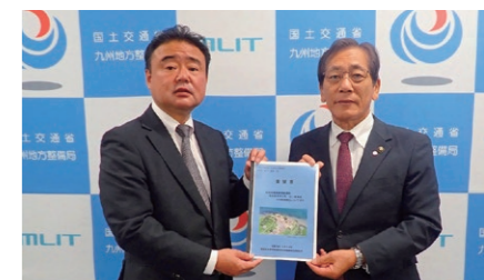
(国土交通省九州地方整備局長：左)