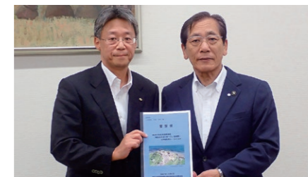
(長崎県土木部長：左)