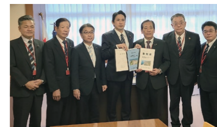
(国土交通省政務官：左から4人目)