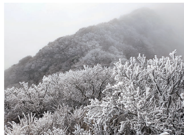
雲仙の霧氷 樹氷(令和5年12月17日撮影)

霧氷は、気温や天候の違いで3つの種類に分けられます。このうち-7℃以下でほとんど風がない状況で木の枝を取り囲むように丸く成長したものが「花ぼうろ」と呼ばれます。北から吹きつける季節風が東シナ海を通過してくる間に多くの水分を蓄え、この湿った冷たい季節風が標高1,500m近い雲仙岳にぶつかることで、きれいな霧氷が作り出され、雲仙の山々では美しい霧氷を見ることができます。