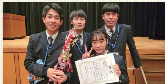
生徒課題 研究研修会

本校では、地域について学び、地域の魅力を発信するふるさと教育に力を入れて取り組んでいます。