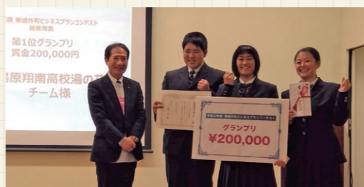
東彼杵町 ビジネス コンテスト