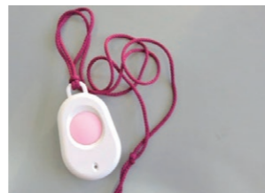
緊急通報システム ペンダント