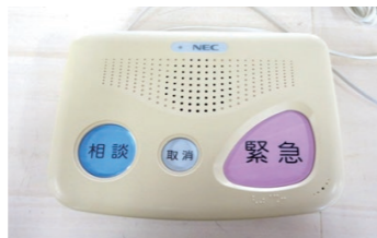
緊急通報システム 本体

また、緊急通報センターからの呼びかけに反応できないなど、本人の状態が確認できない場合は、地域の協力員(事前登録制)と連携して、安否確認を行った上で救急車を手配するなどの対応を行う場合があります。