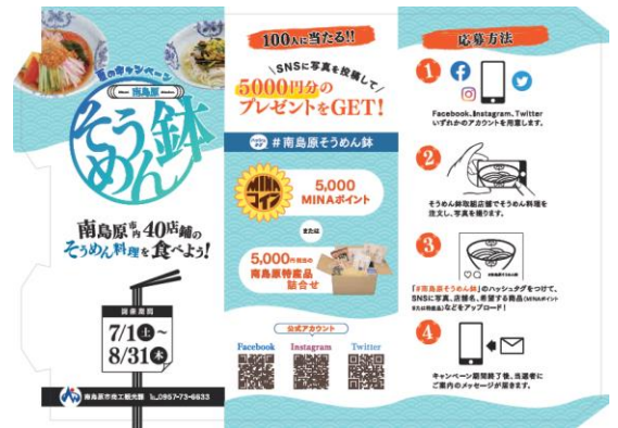
卓上三角柱 POP の制作（例）