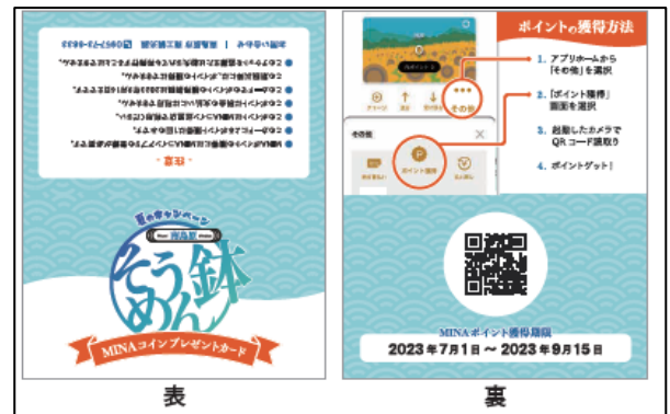
MINA ポイント付与用カード