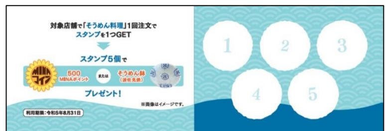
スタンプラリー台紙